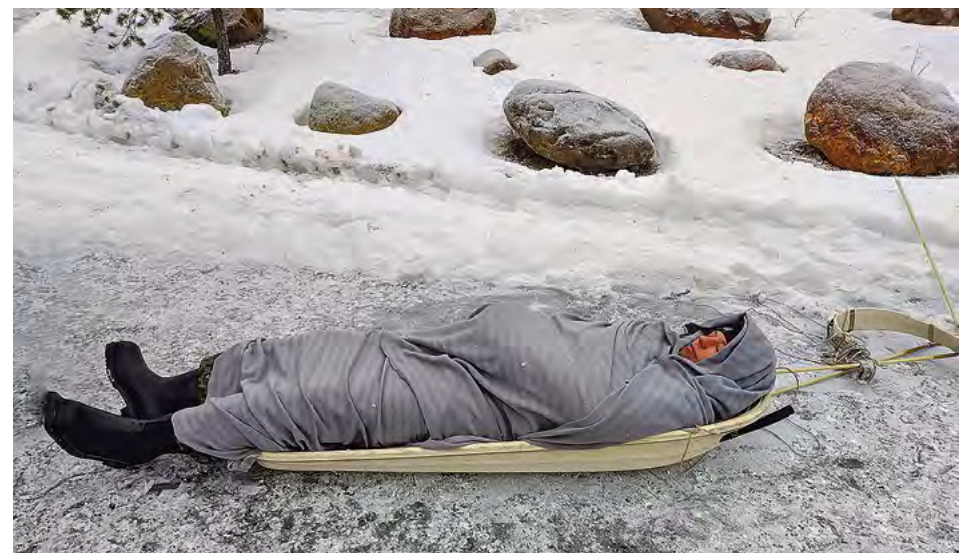
Tutankhamon on kasvanut ulos sarkofagistaan? Ehei, vaan hypoteettinen hypotermiapotilas Tommi Uitti Talvitaidoilta on saanut ensiavun ja pakattu evakuointia varten.