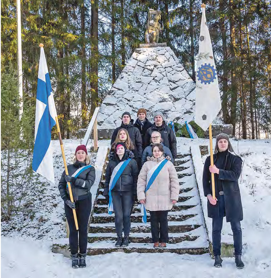
Kuvassa tilaisuuteen osallistuneet Tampereen ammattikorkeakoulun opiskelijakunnan (TAMKO) ja Tampereen Insinööriopiskelijoiden (TIRO) opiskelijat.