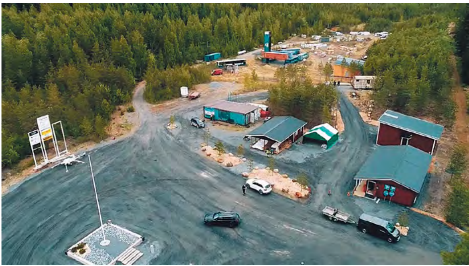
Kesäinen ilmakuva rakenteilla olevasta SäRes-Centeristä. Oikeassa alakulmassa lähinnä opetusrakennus Aulanko ja sen takana käymälärakennus, keskellä konttien ja pressuteltan välissä johtola eli Ilomäki.

katokset, joissa voi järjestää mm. materiaaliesittelyjä ja toisaalta kovalla sateella voi pitää koulutusta säältä suojassa, myös ruokailu onnistuisi niissä helposti.