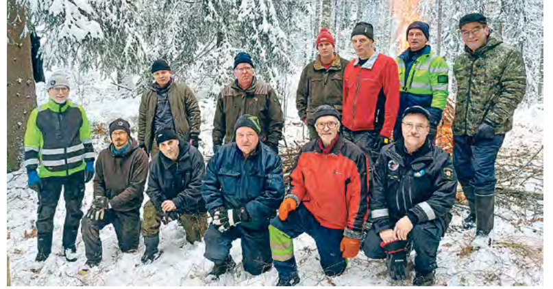
Joulutulia valmisteltiin 10.12. Talkoot onnistuivat hienosti – hommat on tehty!