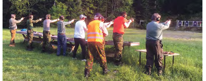
Ammuntoja järjestimme vuonna 2022 entistä enemmän. Yhteisiä ampu- maharjoituksia pidimme helmi-joulukuussa 45 kertaa. Lisäksi monet kä- vivät radalla omalla ajalla. Pälkäneen reserviläisistä ampumassa kävi 29 aliupseerikerhon jäsentä ja 12 upseeria. Vierasampujakin oli noin kolme- kymmentä. Penkkoihin ammuttiin yli 15000 kutia.