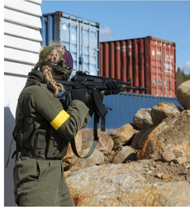
Airsoft-peliä rakennetulla alueella SâRes-Centerissä.

Airsoft-aseet ovat matalatehoisia ilma-aseita, jotka muistuttavat ulkonäöltään ja mitoiltaan tuliaseita. Biomuovista valmistettavat kuulat ladataan aseiden lippaisiin, ja liipaisinta painettaessa kuula saatetaan matkaan piippuun johdetulla paineella. Paine saadaan aikaan ponnekaasun tai mäntäkoneiston avulla. Aseen mäntäkoneisto viritetään asemallista riippuen joko sähkömoottorilla tai lihasvoimalla. Airsoft-kuulat kantavat asemallista riippuen noin 30–90 metriä.